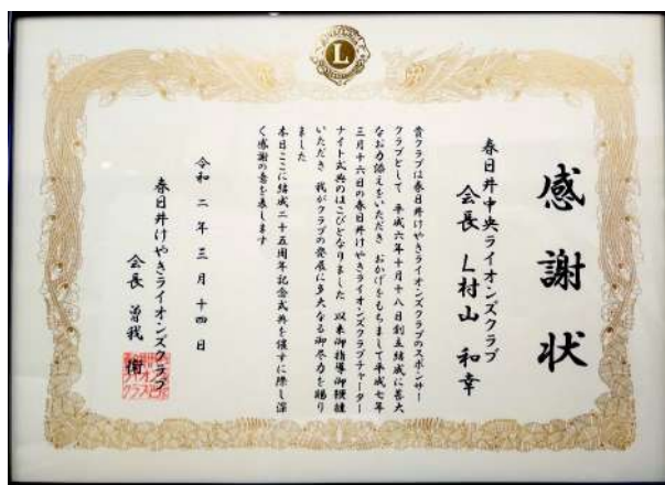
3月19日 けやきLC 25周年記念感謝状