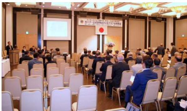
ガバナー公式訪問 合同例会 風景