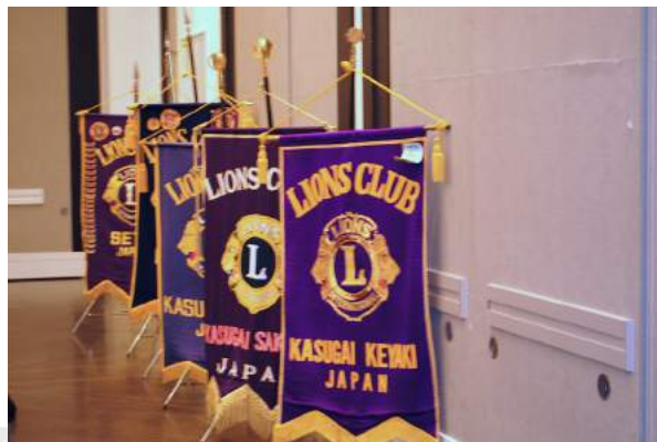
6クラブ合同例会 クラブ旗