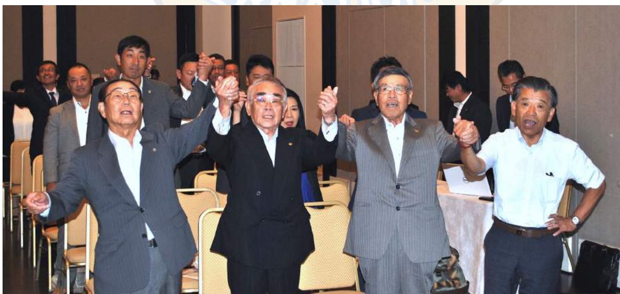
また会う日まで 斉唱