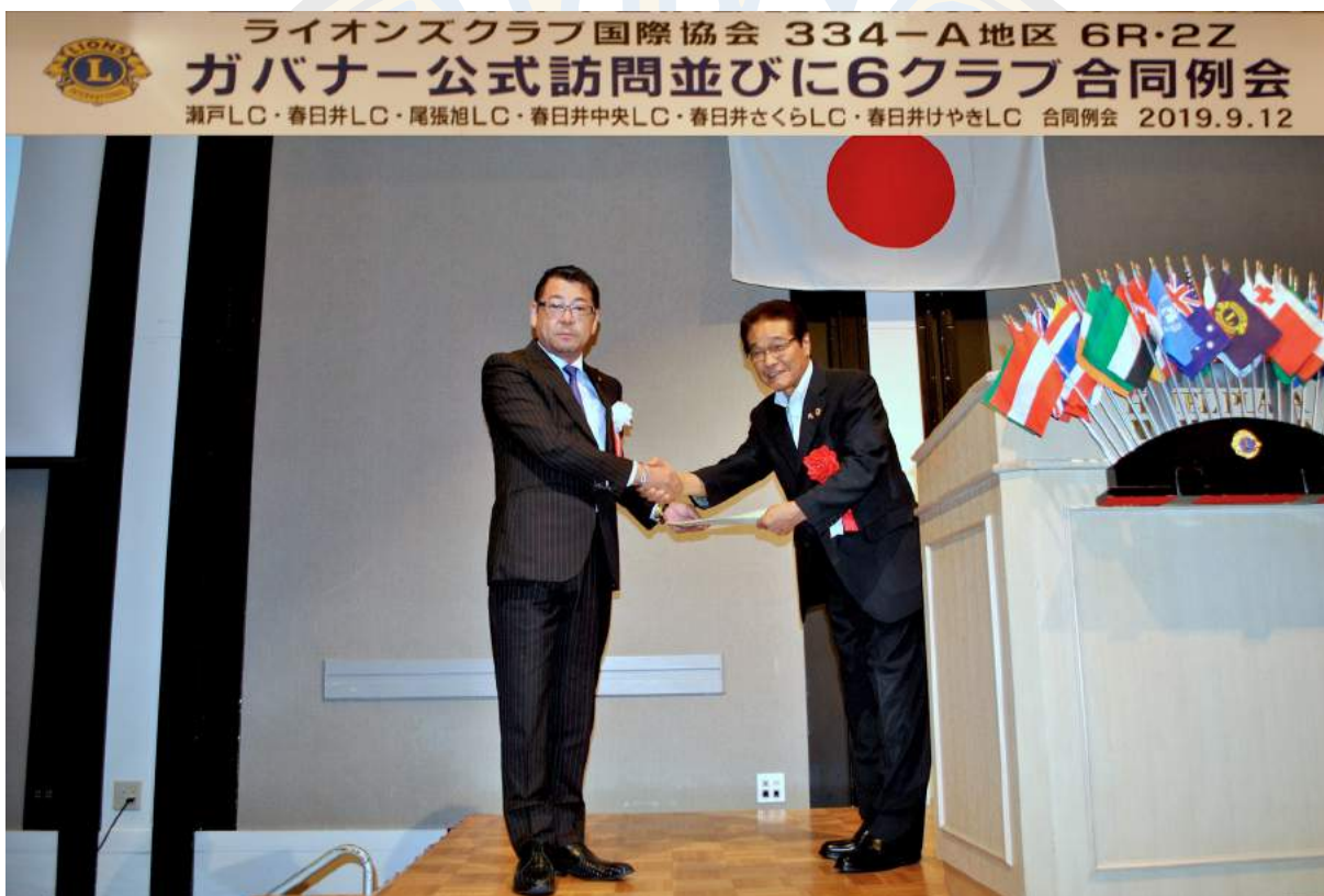
ガバナー公式訪問 質問書回答提出