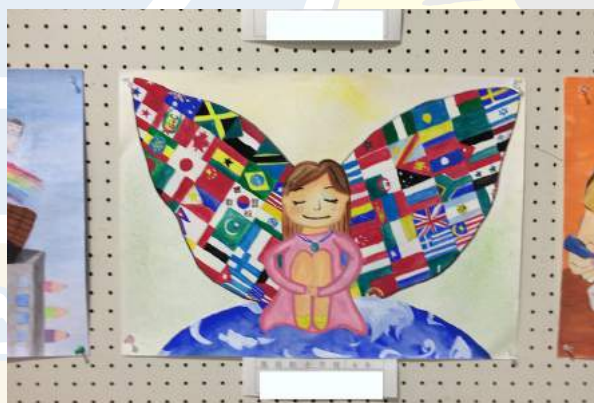
幹事賞 表彰 L灰崎信吉