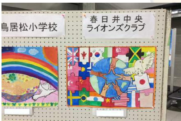
会計賞 表彰 L加藤太