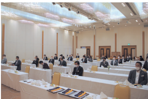
6月第一例会 例会風景