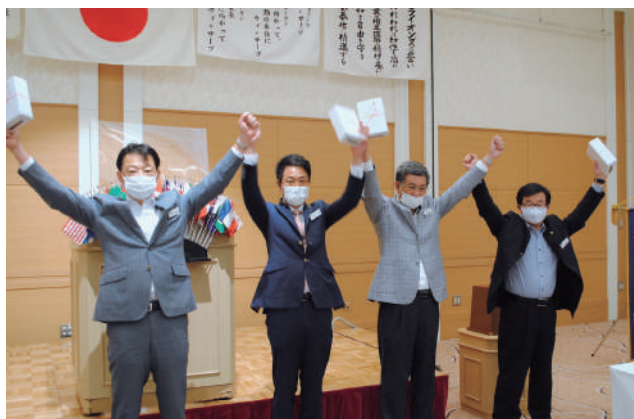
6月誕生日のお祝い ローア一斉