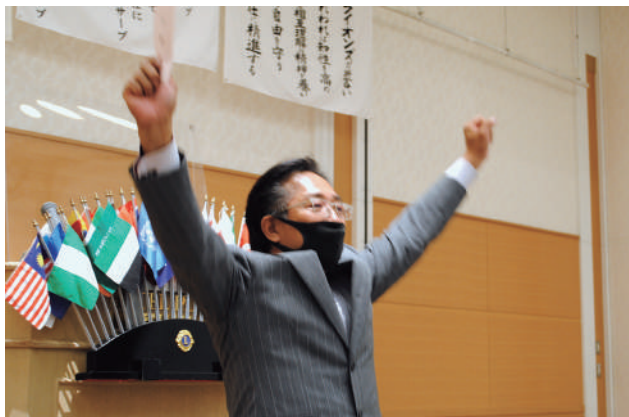
6月結婚記念日のお祝い ローア