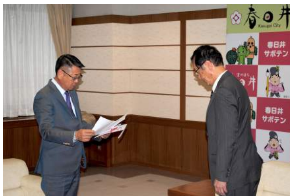
春日井市長へ目録贈呈