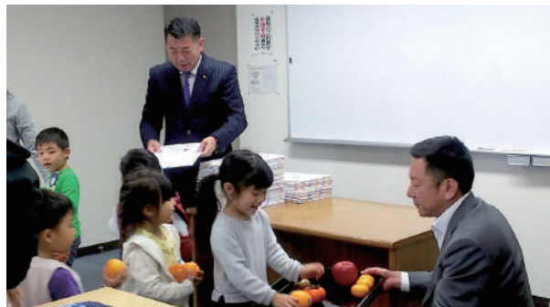
園児より三役に贈呈