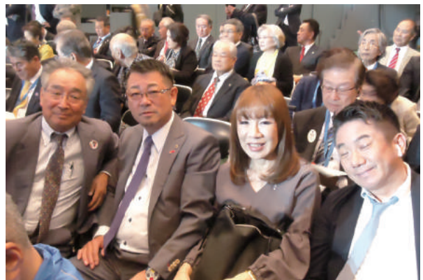
アジアフォーラム 会場風景②