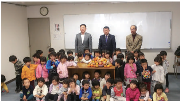
11月12日 美園幼稚園 収穫祭 報告会