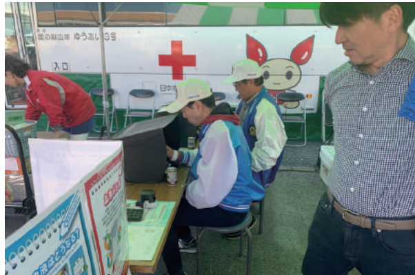
メンバーによる献血協力