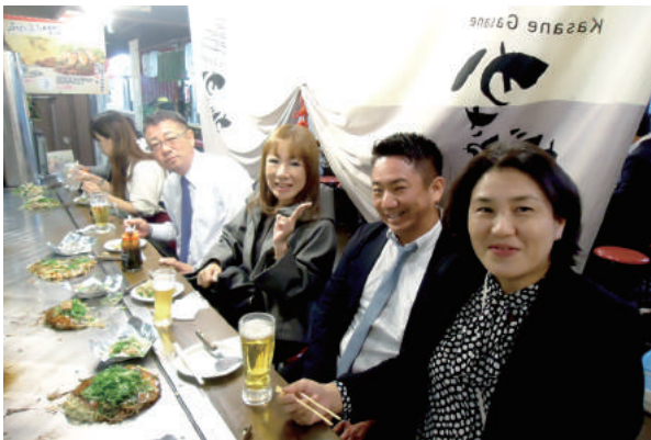
広島・お好み焼き村①