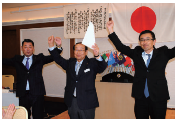
モナーク・シェブロン賞 ローア一斉