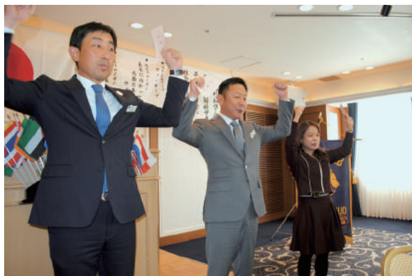
11月結婚記念のお祝い ローアー斉