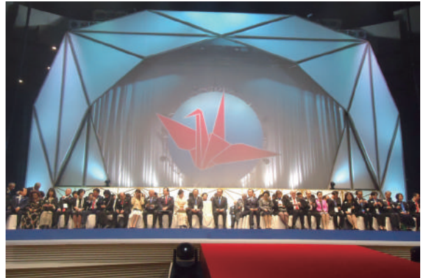
第58回東洋・東南アジアフォーラム 式典