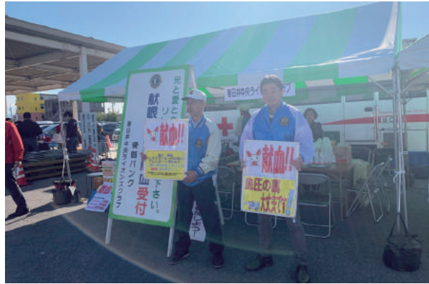
11月9日 福祉の集い 献血運動