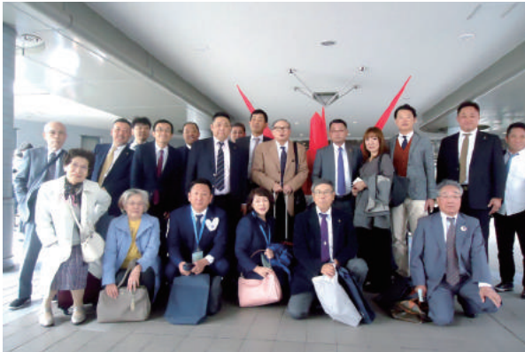
アジアフォーラム 会場 記念撮影