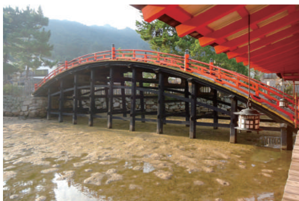
宮島・厳島神社 風景⑤