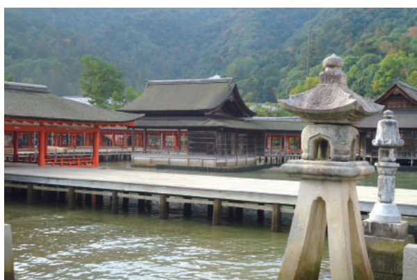
宮島・厳島神社 風景③