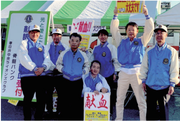
11月9日 福祉の集い 献血運動