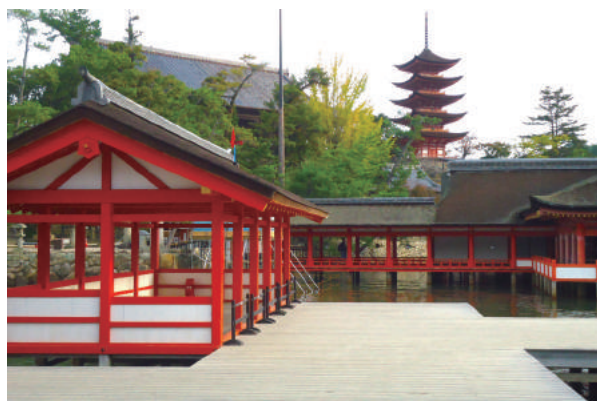
宮島・厳島神社 風景②