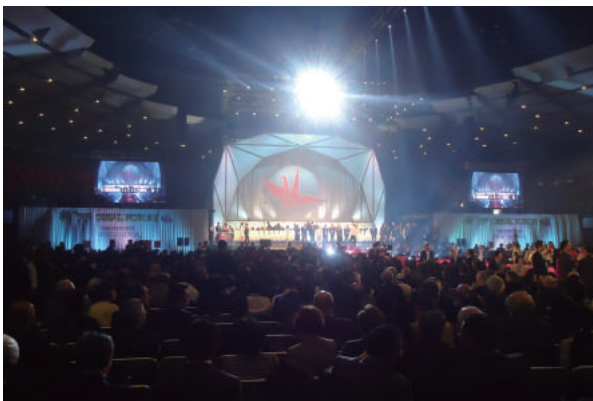
アジアフォーラム 会場風景①