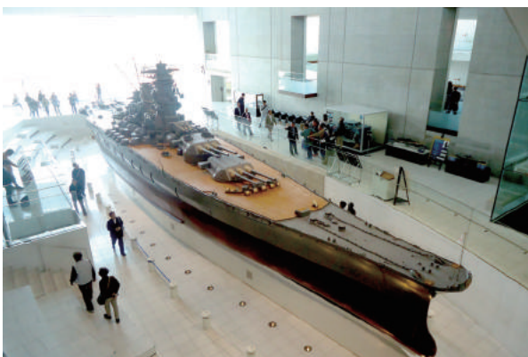
呉市・大和ミュージアム