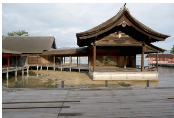
宮島・厳島神社 風景⑥