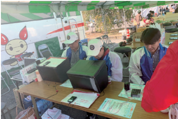
メンバーによる献血協力