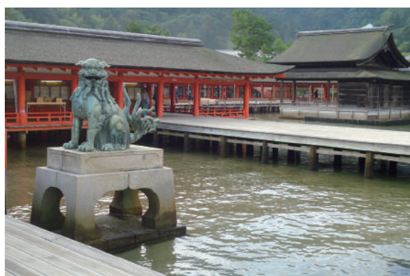
宮島・厳島神社 風景④