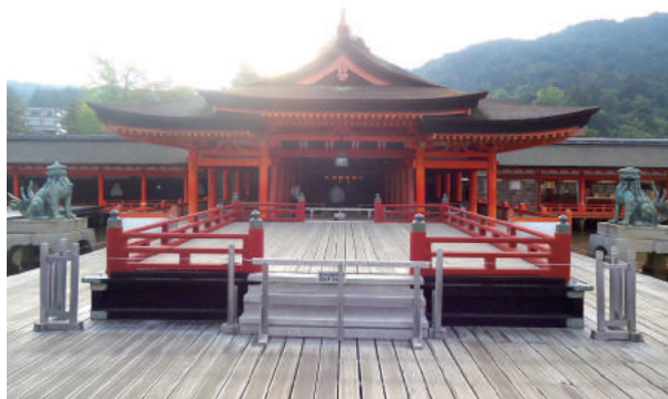
宮島・厳島神社 風景①