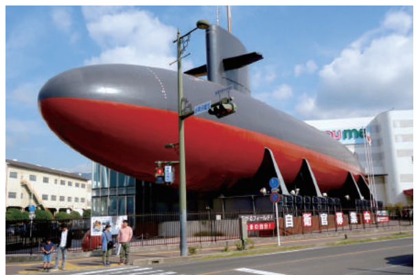
呉市・海上自衛隊呉史料館