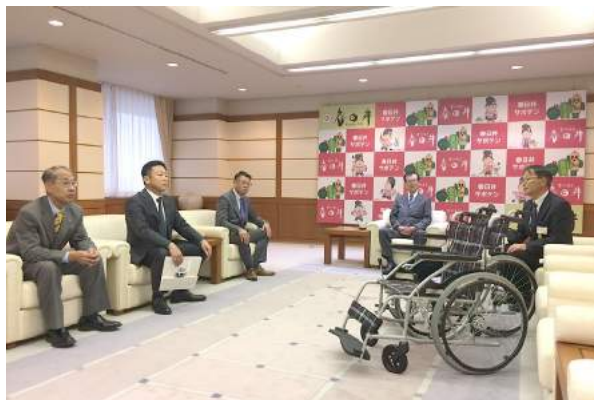
三役と春日井市長による懇談