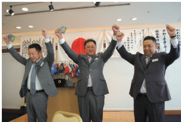
LCIFアワード ライオン・アクションピン受賞 ローア一斉