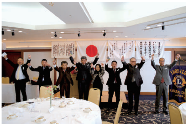
LCIFアワード ライオン・デディケーションピン受賞 ローア一斉