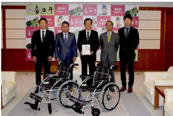
目録贈呈式 記念撮影