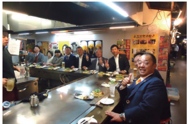
広島・お好み焼き村②