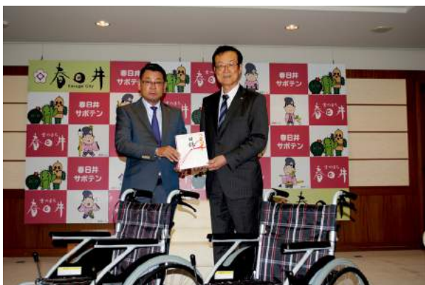
11月18日 メインアクト 目録贈呈式