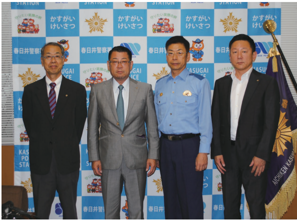
7月3日 春日井警察署長 表敬訪問