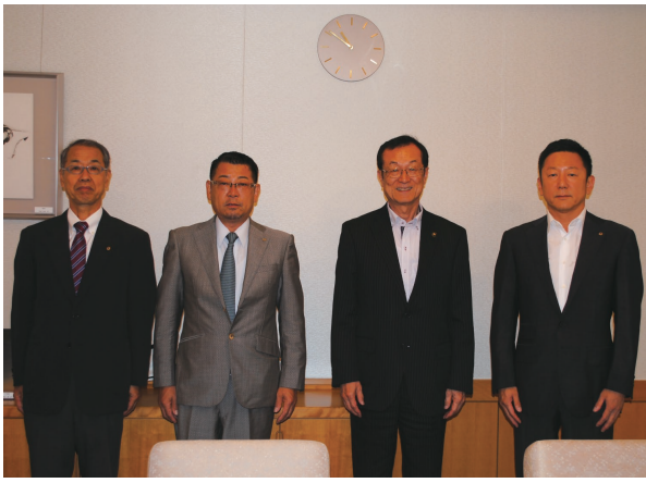
7月3日 春日井市長 表敬訪問