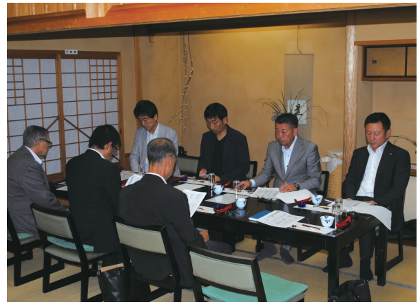
7月5日 新旧合同臨時理事会が開催されました