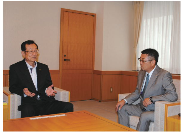
春日井市長と村山会長 懇談